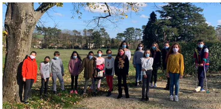
Les Conseillers Municipaux Enfants 2020/2021