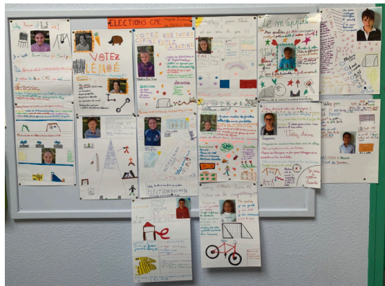
Les campagnes électorales des candidats

La crise sanitaire a quelque peu bouleversé le déroulement du scrutin qui n'a pu être ouvert au public comme les autres années. Des conseillers municipaux (adultes) ont fait voter les enfants en déplaçant l'urne de classe en classe, dans le respect du protocole sanitaire. Le dépouillement s'est déroulé à huis clos.