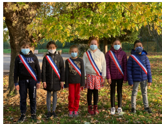
6 nouveaux CM1 rejoignent le CME

Cette année, dans un esprit d'apprentissage de la citoyenneté, la notion de parité a été ajoutée au règlement du scrutin. En effet, les électeurs avaient obligation de désigner au moins 2 filles et au moins 2 garçons.